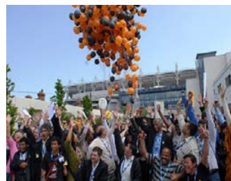
Lancio di palloncini per celebrare l'adozione del Trattato—Dublino 30 maggio 2008