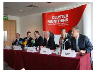
Presentazione del testo adottato