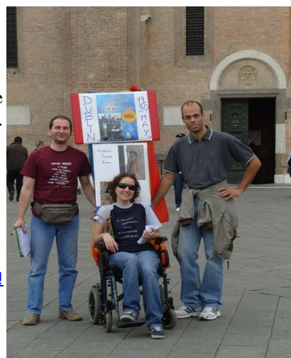
Sensibilizzazione per le strade di Padova