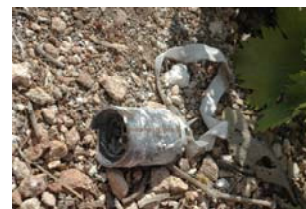
SUBMUNIZIONI IN LIBANO

Conto corrente bancario N° 509050 Banca Etica ABI 05018 CAB 12100 intestato a: Campagna Italiana contro le Mine