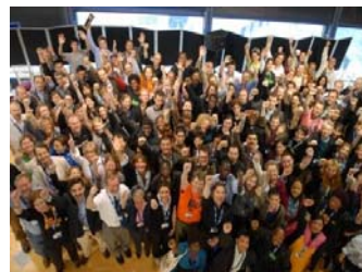
Il gruppo della Cluster Munition Coalition