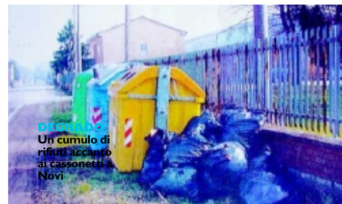
DEGRADO Un cumulo di rifiuti accanto ai cassonetti a Novi

UN GRUPPO di lavoratori della Ferrari ha annunciato a Maranello di avere fondato un partito 'Prospettiva operaia' che — dicono — avrà valenza nazionale: «Ci presenteremo sia alla Camera che al Senato». E' iniziata ieri al mercato di Formigine la raccolta firme necessarie per la presentazione dei vari collegi. Martedì sarà presentato il logo del partito.