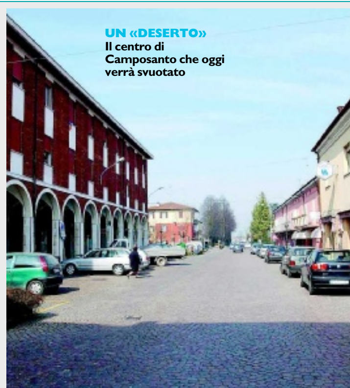
UN «DESERTO» Il centro di Camposanto che oggi verrà svuotato

CAMPOSANTO DAL PRIMO MATTINO ALLONTANATE CIRCA 3MILA PERSONE